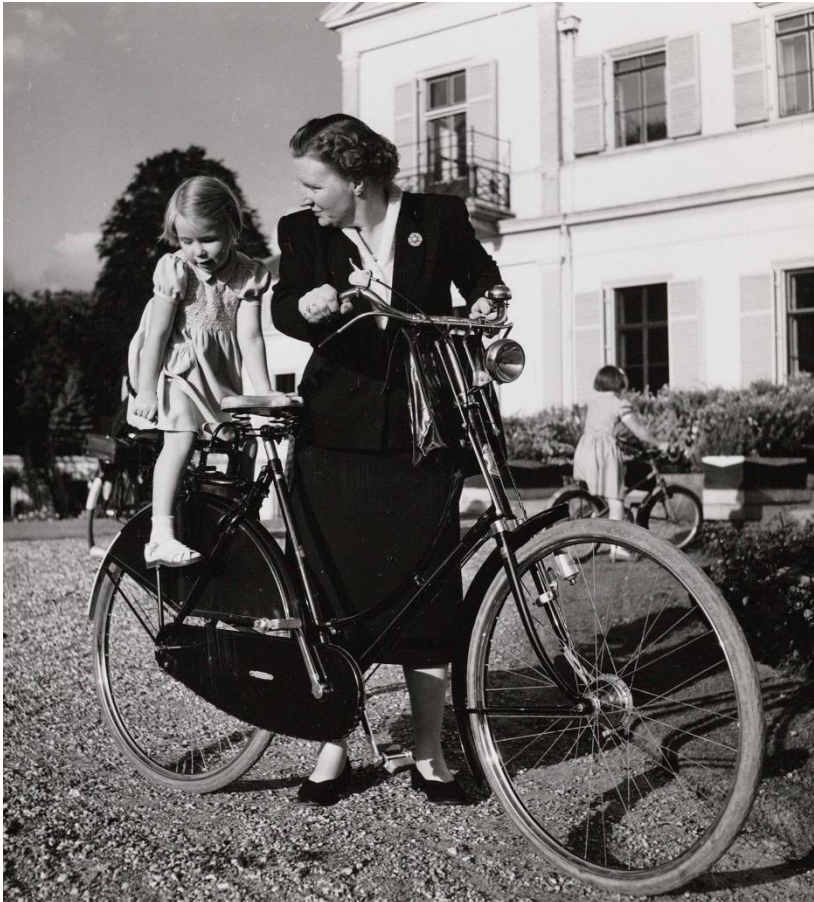
Königin Juliana mit ihrer jüngsten Tochter, Prinzessin Marijke Christina, 1952.

Wenige Königinnen standen ihrem Volk so nahe wie Juliana, die Regentin der Niederlande. Sie hielt nichts auf höfisches Gehabe, wie z. B. den Knicks zur Begrüßung oder die Anrede „Königliche Hoheit“. Sie wollte sich nicht als kühle, unnahbare Regentin zeigen, sondern ihren Untertanen das Königshaus nahebringen.