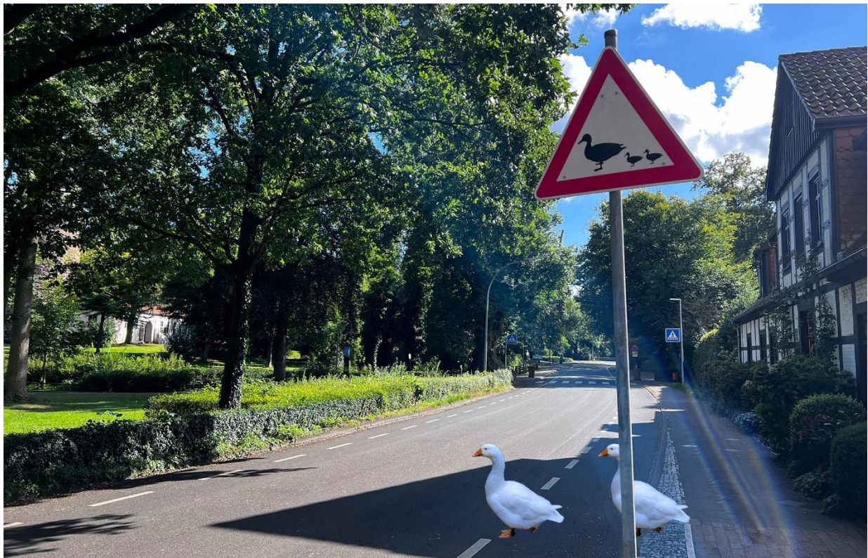
Vorsicht Gänsemarsch !!!

”Freundschaft ist das Band, das mich sichert und hält, wenn alle Stricke reißen!”