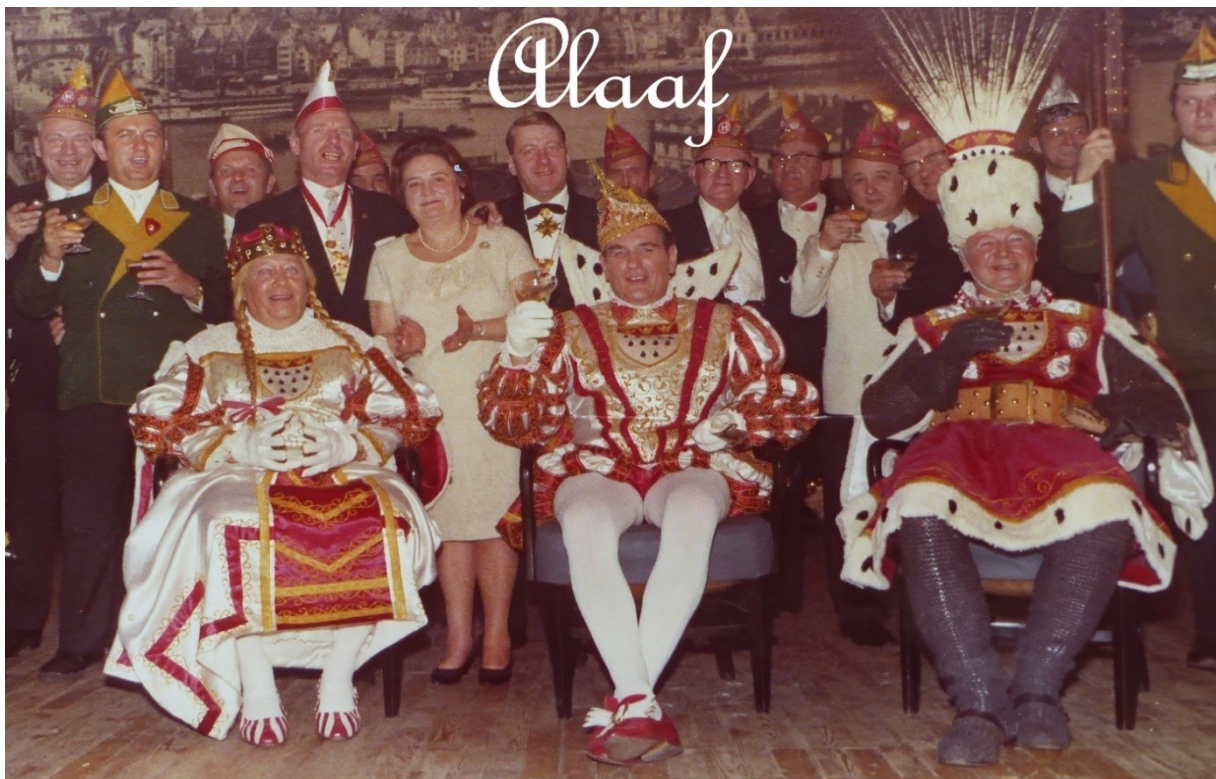
Blick zurück auf das Kölner Dreigestirn in den Sechzigern: Jungfrau, Prinz und Bauer.

"Hab' immer vor Augen das herrliche Ziel, erreichst Du nicht alles, erreichst Du doch viel."